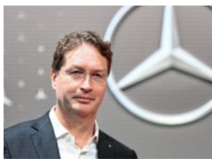
Ola Källenius ist Vorstandsvorsitzender der Mercedes-Benz-Group AG.

Mit Blick auf das laufende Geschäftsjahr rechnet Mercedes nun mit einem Konzernumsatz deutlich unter dem