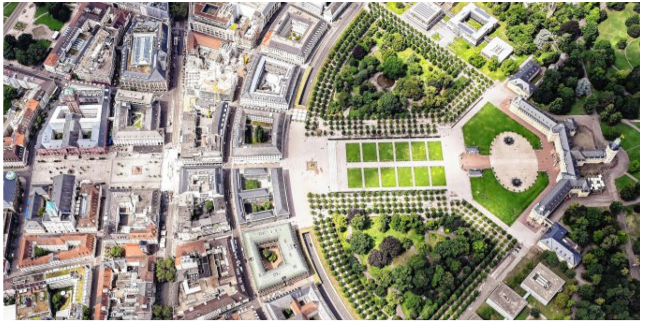
Luftbild von Karlsruhe mit Schloss: Ein Hackerangriff traf 2023 die IT-Struktur der Stadt. Die Verwaltung nahm die Server von 77 allgemeinbildenden Schulen vom Netz. Acht Schulen waren konkret betroffen, bei zehn mussten die Server ausgetauscht werden.

Die Gefahr von Cyber-Angriffen für Unternehmen unterstreicht eine neue Umfrage des Bundesamts für Sicherheit in der Informationstechnik (BSI) und des TÜV. „Die deutsche Wirtschaft steht im Fadenkreuz staatlicher und krimineller Hacker, die sensible Daten erbeuten, Geld erpressen oder wichtige Versorgungsstrukturen sabotieren wollen“, erklärte TÜV-Chef Michael Fühlig im Juni. „Allerdings scheinen viele Unternehmen die Risiken zu unterschätzen.“ Der Untersuchung nach sind im